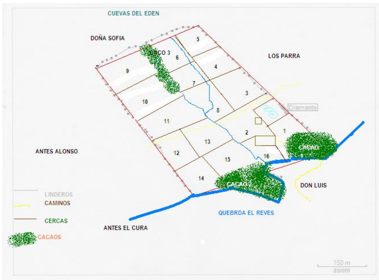
Diagrama de la distribución de la finca:

Quebrada el REVES lindero sur oriental. Divide el predio de Norte occidente a Sur oriente una quebrada secundaria, y una sequia paralela a la anterior u que desemboca en la misma a la altura de la mitad del potrero denominados 8. Se cuenta con un tomas de agua de 2" de la quebrada que nace en las cuevas del EDEN.